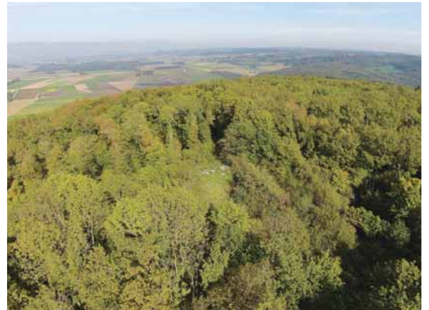
Le sommet du Mormont est classé à l'Inventaire Fédéral des Paysages (IFP).

ENVIRONNEMENT - Le comité de l'initiative «Sauvons le Mormont» a annoncé le lancement de la récolte des signatures dès ce vendredi 14 janvier. Cette initiative vise à inscrire dans la Constitution vaudoise la protection du Mormont et l'encouragement aux matériaux de constructions alternatifs au béton, durables et locaux. Le comité d'initiative, composé des Verts, du parti Socialiste, de solidaritéS, de décroissance alternatives, du POP, des Jeunes Verts, de la Jeunesse socialiste, de l'Association pour la Sauvegarde du Mormont et de Pro Natura Vaud, considère en effet que l'utilisation de ressources naturelles pour la construction, ainsi que la planification générale des projets, doivent favoriser au maximum des matériaux renouvelables et respectueux de l'environnement. Et que la protection des paysages, sites et biotopes, de même que la richesse patrimoniale et archéologique, doivent être prises en compte de façon centrale dans ce contexte.